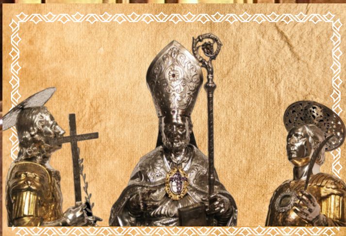
BUSTI RELIQUIARI DEI SANTI PATRONI (Cripta)