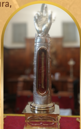
BRACCIO RELIQUIARIO DI SAN MAURO

La Cattedrale è un affascinante esempio di romanico pugliese, con la pianta latina rivolta a oriente e divisa in tre navate, sovrastata da eleganti e robuste arcate.