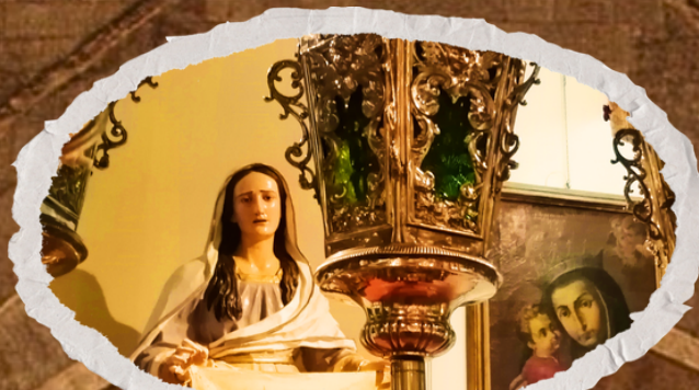
STATUA DELLA VERONICA, QUADRO DELLA VERGINE E LAMPADE PROCESSIONALI (Museo Diocesano)